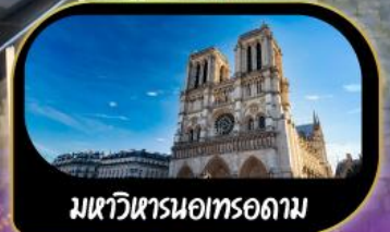
มหาวิหารนอทรอดาม