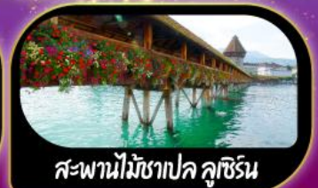
สะพานไม้ฆาปค ลูซิริน