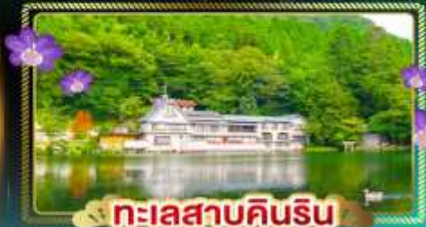
ทะเลสาบคินริน