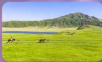
ภูเขาไฟอะโฮะ ทุ่งหญ้าคุสะเซนริ