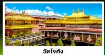
วัดโจกิง

🧳 พกกระเป๋า 1 ชิ้น น้ำหนัก: 4 กิโลกรัม (รวม 2/ข้าง)