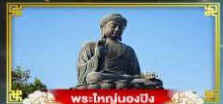
พระใหญ่ของปิง