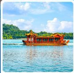
ล่องเรือทะเลสาบหลิวเยวู่หู