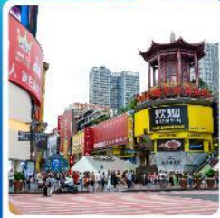
ถนนหวงซิงสู