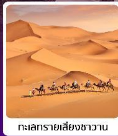
ทะเลทรายสีงชาวน