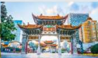
ประตูน้ำทองไก่อ๋หยก