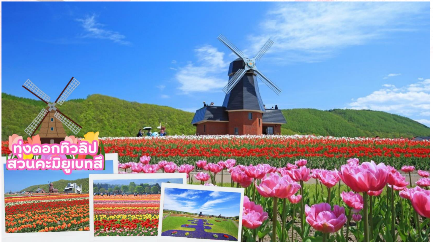
ทุ่งดอกทิวลิป สวนคะมิยูเบทสึ

จากนั้นนำท่านชมทุ่งดอกทิวลิป ณ สวนคะมิยูเบทสึ (Kamiyubetsu Tulip Park) จากสวนดอกไม้เล็ก ๆ ที่ถูกสร้างขึ้นโดยคนท้องถิ่นเพื่อสืบทอดดอกทิวลิป [ดอกไม้ประจำเมือง] ไปสู่รุ่นต่อไป และได้พัฒนา มาเป็นอุทยานทิวลิปคะมิยูเบทสึ ปัจจุบันอุทยานแห่งนี้มีดอกทิวลิปสีแสนสดใส กว่า 1,200,000 ดอก จาก กว่า 120 สายพันธุ์ ที่จะบานทั่วทั้งสวนในฤดูใบไม้ผลิ [ขึ้นอยู่กับสภาพอากาศ]