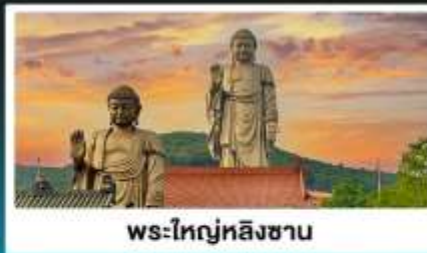
พระใหญ่หลิงซาน