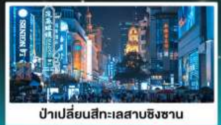
ป่าเปลี่ยนสีทะเลสาบชิงชาน