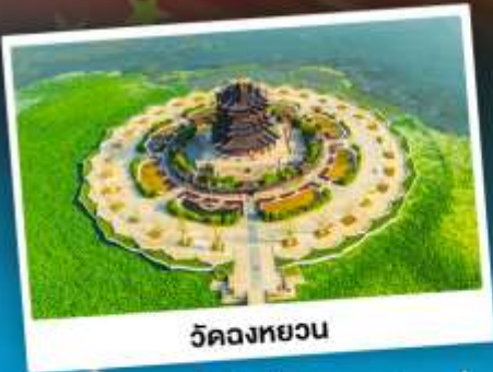
วัดทองยวน