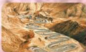
ถนนโบราณผืนหลงกู่ต้า