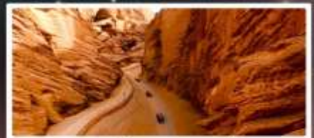
แกรนด์แคนยอนอาถูซื่อ