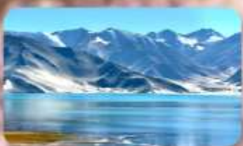
ทะเลสาบไป่ซาหู