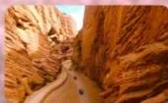
แกรนด์แคนยอนอาวูซือ