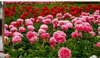
สวนดอกโบตั๋น