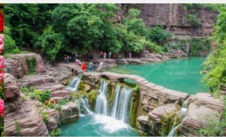
อุทยานหยุนโถซาน

*ทางบริษัทฯ ขอสงวนสิทธิ์ในการสลับโปรแกรมทัวร์ตามความเหมาะสมขึ้นอยู่กับสถานการณ์หน้างาน โดยคำนึงถึงผลประโยชน์ของลูกค้าเป็นสำคัญ