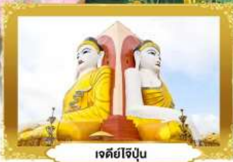
เจดีย์ไข่มุก