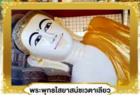
พระพุทธรูปไสยาสน์ชเวตาเลียว