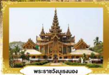
พระธาตวง์บุเรงนอง

ย่างกุ้ง • หงสาวดี • อินทร์แวง | 3 วัน 2 คืน