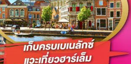
เก็บครบเบเนลักซ์ แวะเที่ยวฮาร์เล็ม