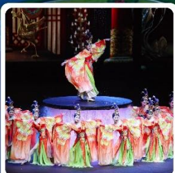
โชว์ FOSHAN QIANGQING