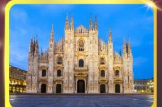
มหาวิหารแห่งเมืองมิลาน