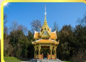
ศาลาไทยไลซานซ์