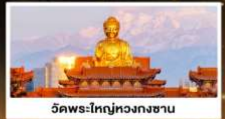
วัดพระใหญ่หวงกงซาน