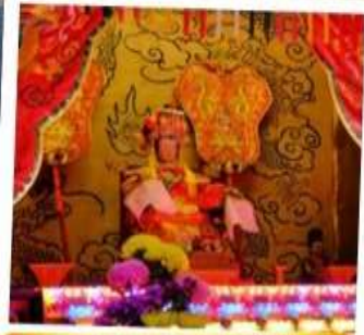
เจ้าแม่ทับทิม จอสเฮ้าส์เบย์