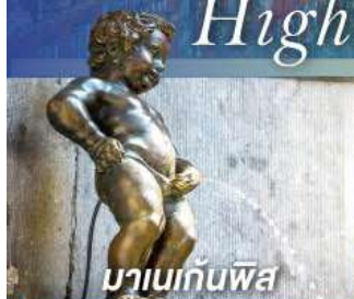
มานเนกันพิส