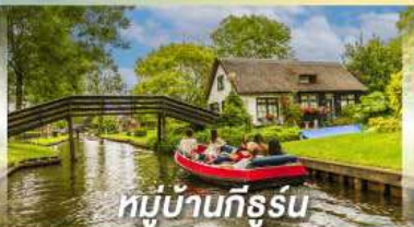
หมู่บ้านทึร์สุน