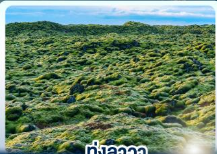
ทุ่งลาวา