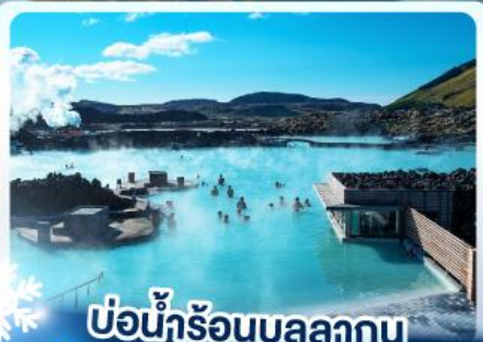
แช่น้ำร้อนบลูลากูน

เก็บไอซ์แลนด์ แดนภูเขาไฟคิรูกูฟลา และ แช่น้ำร้อนบลูลากูน