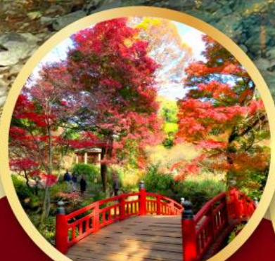
สวนดอกบ๊วยอาคาบิ