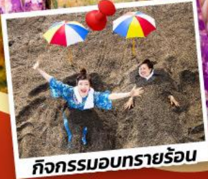
กิจกรรมอบทรายร้อน