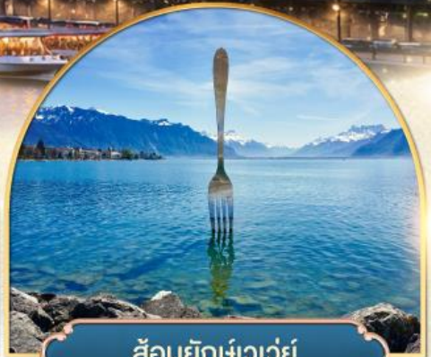
ล้อมยึกเขาวัว