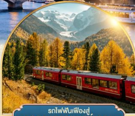
รถไฟฟันเฟืองสู่ ยอดเขากรอนเนอ์เกรต