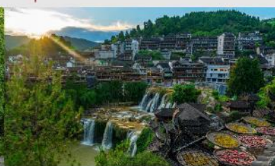
หมู่บ้านโบราณฝูหรงเจิ้น

*ทางบริษัทฯ ขอสงวนสิทธิ์ในการสลับโปรแกรมทัวร์ตามความเหมาะสมขึ้นอยู่กับสถานการณ์หน้างาน โดยคำนึงถึงผลประโยชน์ของลูกค้าเป็นสำคัญ