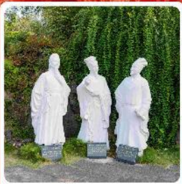
สวนกำแพงสามสาย