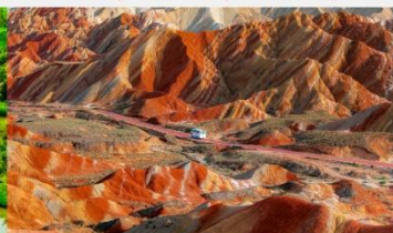
ภูเขาสายรุ้งจางเย่ต้นเสี่ย