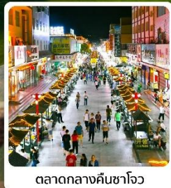
ตลาดกลางคืนซาโจว