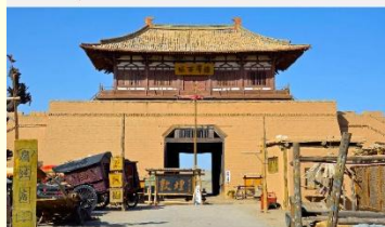
เมืองโบราณตุนหวง