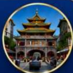
ถนนเปยจิงสู๋ หรือถนนคนเดินปิกกิ้ง