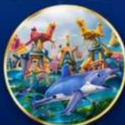
สวนสนุกกลางหลง โอเชียน คิงดอม