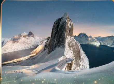
เกาะเซนญา