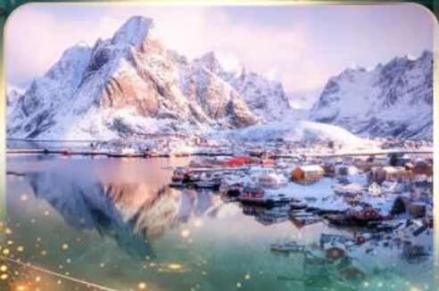
หมู่บ้านเรนเน